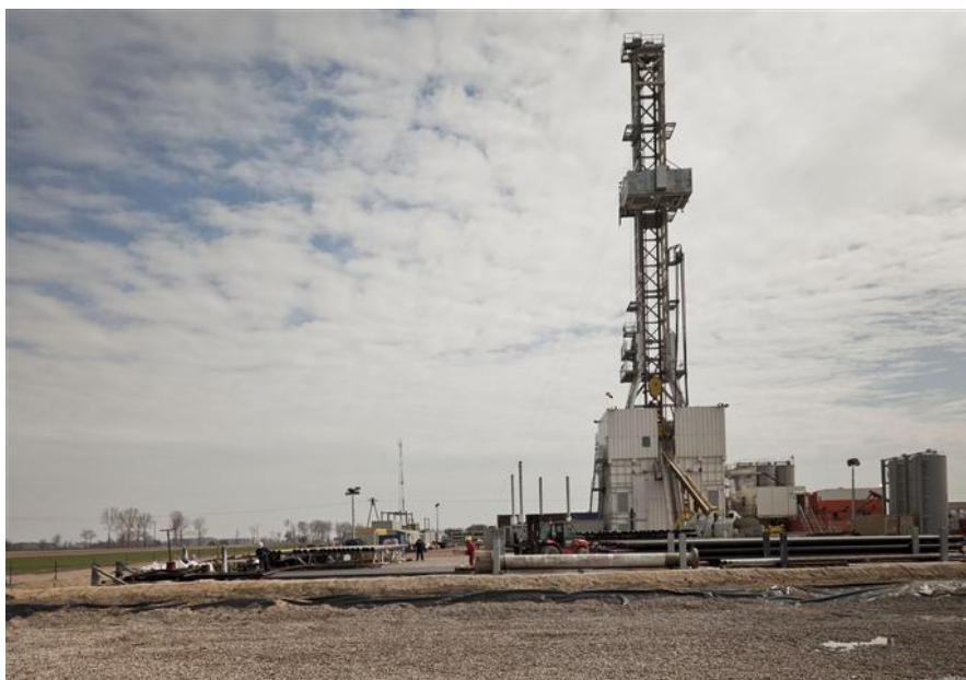
Źródło: http://www.zuromin-powiat.pl/content/view/2349/2/ Zdjęcie wiertni gazu łupkowego w Pietrzyku 42 wykonane przez firmę Marathon Oil.

Zgodnie z obowiązującymi przepisami realizacja tego typu inwestycji poprzedzona jest procedurą oceny oddziaływania na środowisko, podczas której określone zostają szczegółowe warunki wykorzystania terenu w fazie realizacji i eksploatacji z uwzględnieniem konieczności ochrony zasobów naturalnych, cennych walorów przyrodniczych i kulturowych oraz ograniczenia uciążliwości dla terenów sąsiednich a także wymagania dotyczące ochrony środowiska do uwzględnienia w projekcie budowlanym. Zastosowanie rozwiązań służących ochronie środowiska naturalnego ogranicza do minimum możliwe negatywne oddziaływania. Elementem szczególnie wrażliwym na zanieczyszczenie są wody podziemne. Ochrona przed przedostaniem się do nich płynu szczelinującego lub gazu polega na uszczelnianiu odwiertów za pomocą licznych stalowych rur oraz warstw cementu. Warstwy uszczelniające, których wytrzymałość jest poddawana próbom ciśnieniowym, zachowują trwałość przez cały okres przydatności odwiertu. Płyn szczelinujący jest zazwyczaj stosowany na głębokości kilku kilometrów poniżej wód gruntowych. Między warstwami wodonośnymi, a pokładami łupków, które są poddawane szczelinowaniu, leżą grube warstwy nieprzepuszczalnych skał.